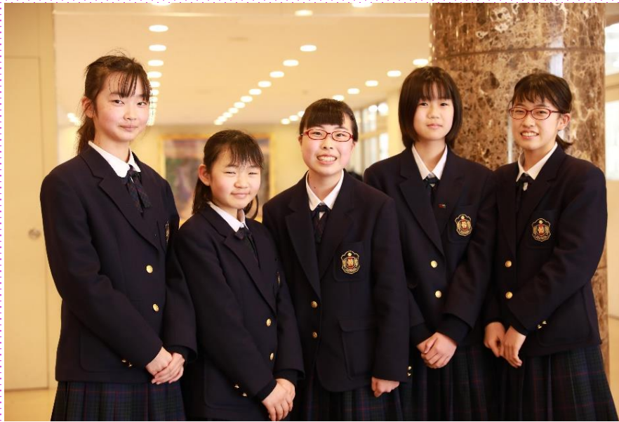
帰国生からのメッセージ(2年)