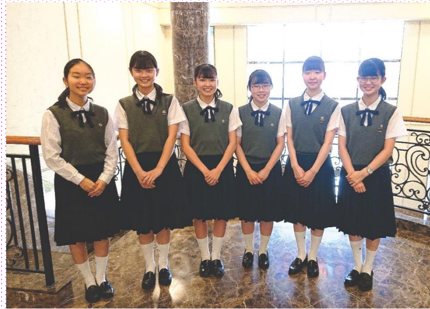
帰国生からのメッセージ(3年)